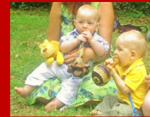
Entwicklungsbegleitung Lernbegleitung, Schulprobleme