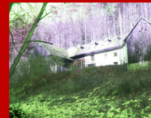
Projektbegleitung Balancierung von belasteten Gebäuden und Grundstücken